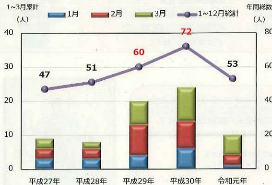
冬季における死亡災害が全体に占める状況

各事業場においては、事業者、労働者が協力して、墜落災害並びに交通死亡災害を防止しましょう。