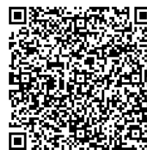
参加申込 QR コード